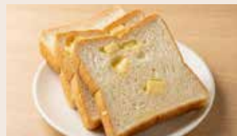
高鈣起司吐司 (蛋奶素)