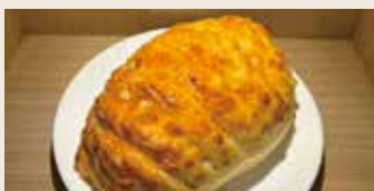
軟歐起司 (蛋奶素) NT$75