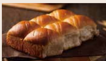
👑 手撕麵包 (蛋奶素) NT$200(6入)