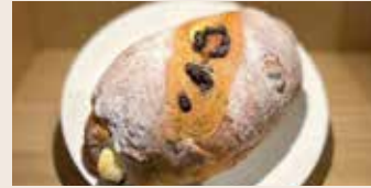
伯爵巧克力 (奶素含酒/含堅果) NT$75