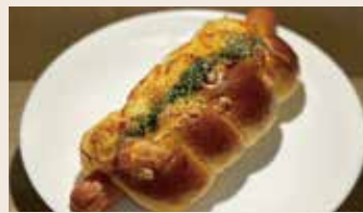
德式香腸卷 (葷食) NT$55