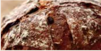
👑 酒香桂圓 (全素含酒/含堅果) NT$240