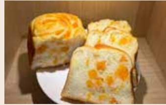
地瓜乳酪吐司 (奶素)