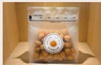
日式焦糖小泡芙 (蛋奶素)