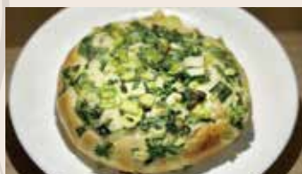
👑 青蔥麵包 (植物五辛素) NT$60