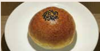
紅豆布里歐 (2顆) (蛋奶素/含堅果) NT$70