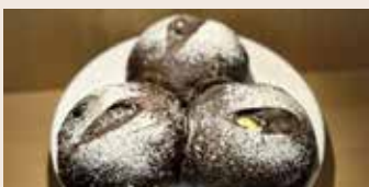
草莓可可 (奶素含酒) NT$75