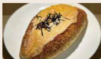
明太子起司 (葷食) NT$70