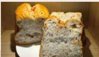
堅果吐司 (奶素/含堅果)