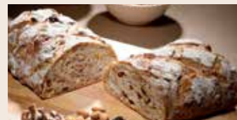
裸麥高纖 (奶素含酒/含堅果) NT$220