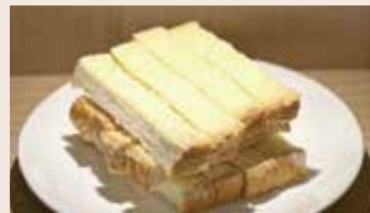
香酥烤吐司 (蛋奶素)