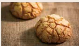
日式波蘿 (蛋奶素) NT$45