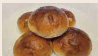
葡萄餐包 (蛋奶素含酒) NT$85