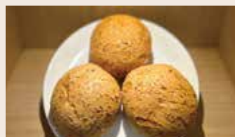
韓國麵包 (蛋奶素/含堅果) NT$65