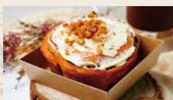
👑 肉桂捲 (蛋奶素含酒/含堅果) NT$85