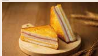
👑 起士三明治 (葷食) NT$65