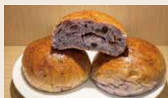
藍莓餐包 (蛋奶含酒/含堅果) NT$75