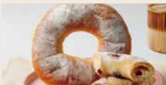
蔓越莓乳酪 (奶素含酒) NT$75