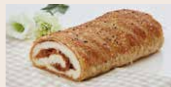
經典麵包 (葷食/含堅果) NT$200