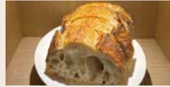
酸麵包 (全素) NT$180