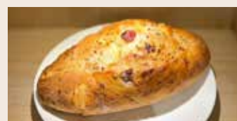
蔓越莓亞麻子 (奶素含酒/含堅果) NT$75