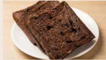
生巧克力吐司 (奶素)