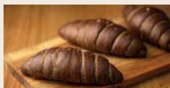
巧克力鹽之花 (奶素) NT$130