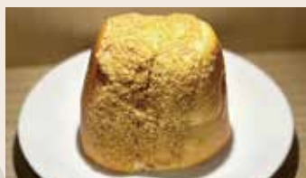
古早味花生夾心 (蛋奶素/含堅果) NT$50