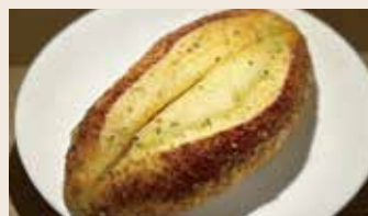
香蒜起司 (葷食) NT$65