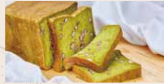
抹茶生角食 (奶素) NT$250