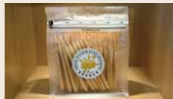
帕馬森起司棒 (蛋奶素)