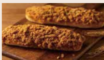
肉鬆麵包 (葷食) NT$55