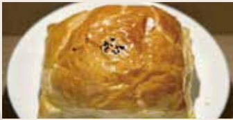
肉鬆酥皮 (葷食/含堅果)