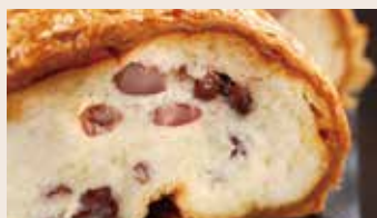
👑 起酥紅豆 (蛋奶素/含堅果) NT$200