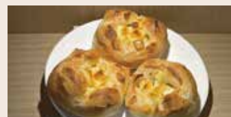
法式起司餐包 (蛋奶素) NT$70