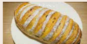
伯爵無花果 (奶素含酒/含堅果) NT$95