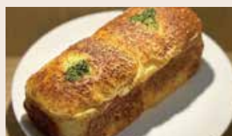
德腸馬鈴薯 (葷食) NT$65