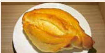
海鹽羅宋 (蛋奶素) NT$63