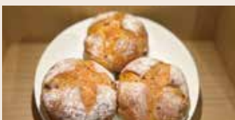
裸麥餐包 (奶蛋含酒/含堅果) NT$80