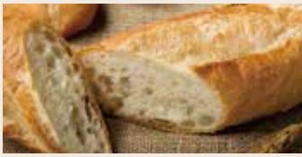
法國麵包 (全素) NT$120