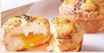
奶皇麻糬菠蘿 (蛋奶素/含堅果)