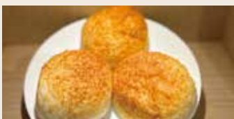
奶皇起司餐包 (蛋奶素) NT$85