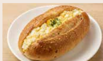
鮭魚蛋沙拉 (葷食) NT$85