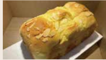
巴布羅吐司 (蛋奶素/含堅果)