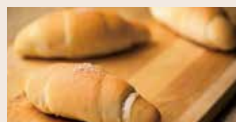
鹽之花奶油捲 (奶素) NT$125