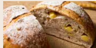
芭蕾堅果 (蛋奶素/含堅果) NT$280