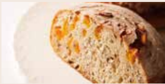
樂活地瓜 (全素/含堅果) NT$180