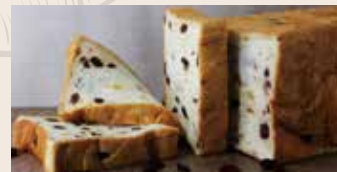
莓果圓舞曲 (蛋奶素) NT$250