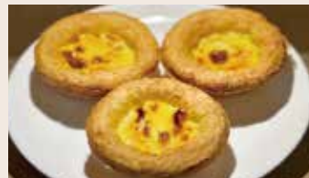
葡式起酥蛋塔 (蛋奶素)