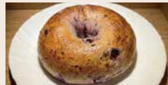
藍莓貝果 (奶素) NT$60